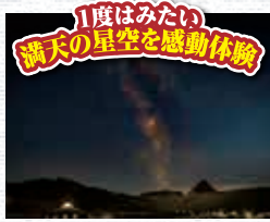
1度はみたい 満天の星空を感動体験