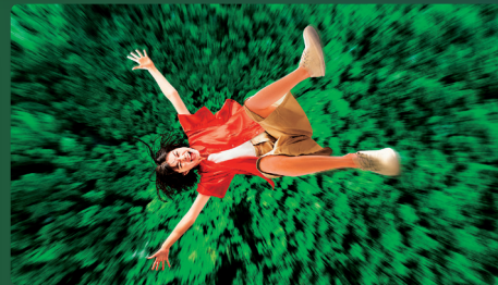
体まるごと、自由落下。 その先、未知の解放感。 GRAVITY DROP グラビティドロップ ※パーク入場後に「整理券」の取得が必要です。

他にもアトラクションが盛りだくさん。詳しくは JUNGLIA OKINAWA オフィシャルWEBサイトをご覧ください。