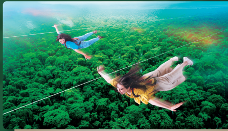
超爽快！ ジャングル上空を飛ぶ鳥になる。 SKY PHOENIX スカイ フェニックス ※パーク入場後に「整理券」の取得が必要です。