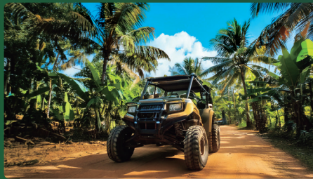
バギーを運転して、南国の大自然を感じよう！ BUGGY VOLTAGE バギー ボルテージ