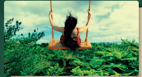
大自然へ、風を切って飛び込む解放感。 TITAN'S SWING タイタンズ スウィング ※パーク入場後に「整理券」の取得が必要です。