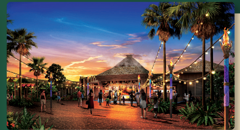
食欲を刺激する、あふれる活気と高揚感。 WILD BANQUET ワイルドバンケット ※食事代金は旅行代金に含まれません。お席の事前予約も不可となります。