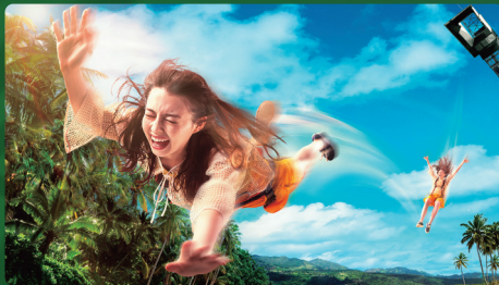
突然の落下、 絶叫する鼓動。 BUNGEE GLIDER バンジー グライダー ※パーク入場後に「整理券」の取得が必要です。