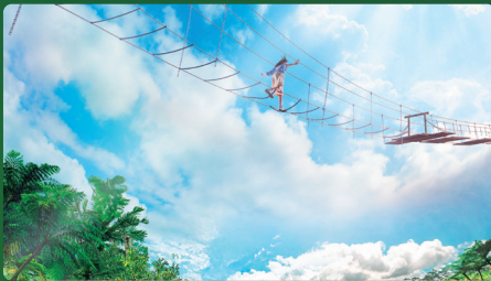
空の上の吊り橋に、想像を超えた緊張と興奮。 SKY-END TREKKING スカイエンドトレッキング ※パーク入場後に「整理券」の取得が必要です。