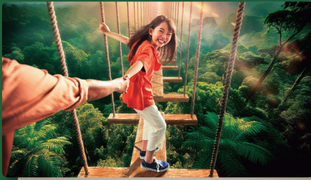
ジャングルの上の大冒険。挑戦するって、おもしろい！ TREE-TOP TREKKING ツリートップトレッキング ※パーク入場後に「整理券」の取得が必要です。