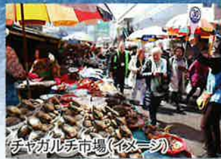
ジャガルチ市場(イメージ)