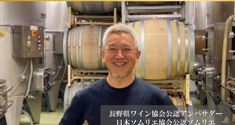
長野県ワイン協会公認アンバサダー 日本ソムリエ協会公認ソムリエ