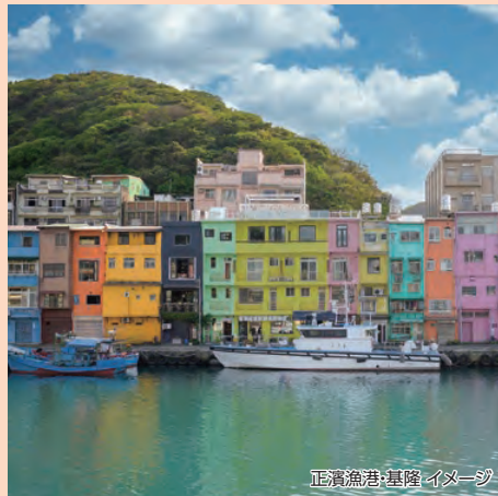
正濱漁港:基隆 イメージ