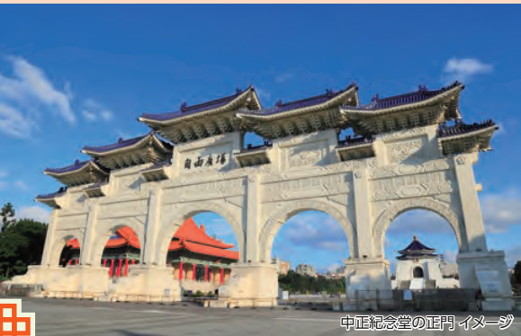
中正紀念堂の正門イメージ

世界四大博物館のひとつに数えられる故宮博物院。清代までの中国の美術品の数々をご覧ください。