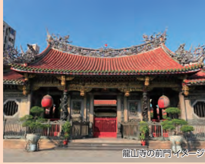
龍山寺の前門イメージ

台北にある京劇シアター。中国の伝統文化をお楽しみいただけます! ※演目は時期によって異なる場合がございます。