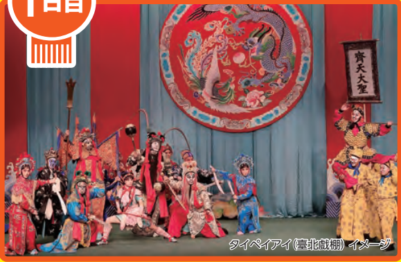
タイペイアイ(臺北戲棚)イメージ