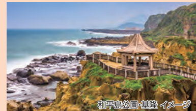
和平島公園:基隆 イメージ