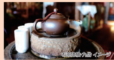
お茶体験 九份 イメージ