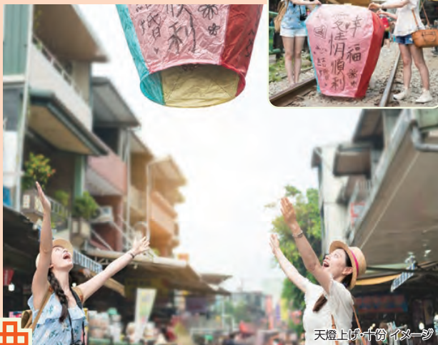
天燈上げ 九份 イメージ