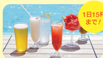
船内のお飲み物代 ※1杯US15ドル以内

ドリンク・パッケージ1日あたり $76.7×7泊=$536.9=約80,000円 (1日15杯1泊15ドル以内)