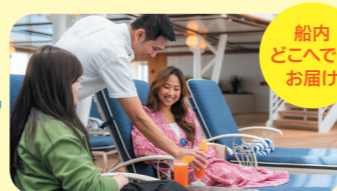
専用アプリでの お食事・お飲み物のご注文