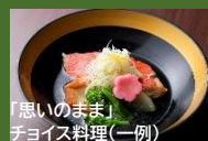
「思いのまま」 チヨイス料理(一例)

メインの料理2品は お席に着いてから おひとり様ずつお 好みの料理をお選 びいただけます。そ の他、前菜やお造り など、季節のお料理 をご提供いたしま す。