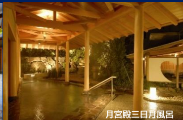
月宮殿三日月風呂