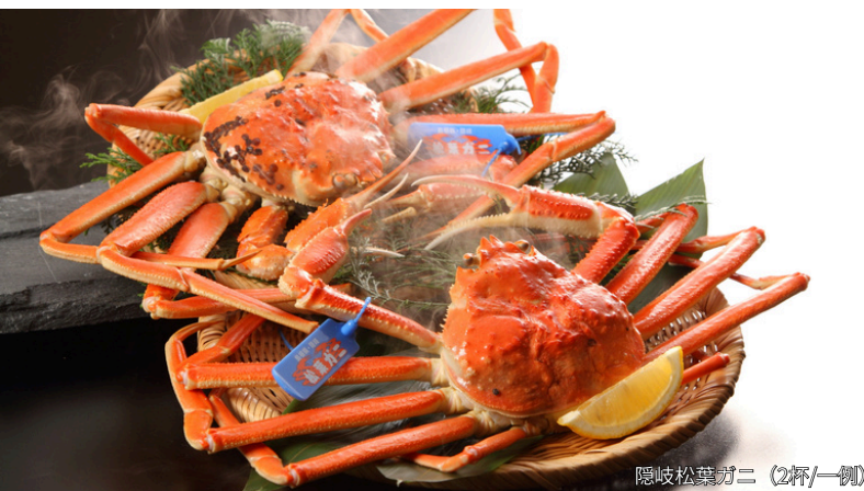
隠岐松葉ガニ (2杯/一例)