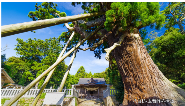
八百杉/玉若酢命神社