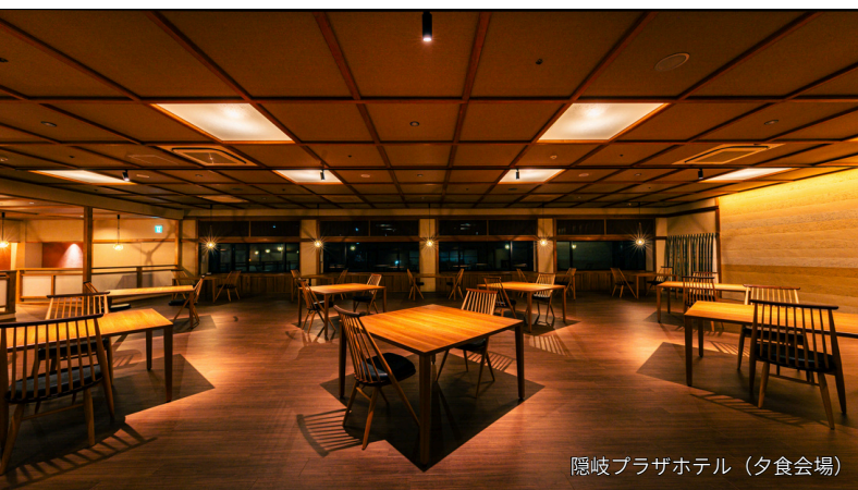
隠岐プラザホテル (夕食会場)