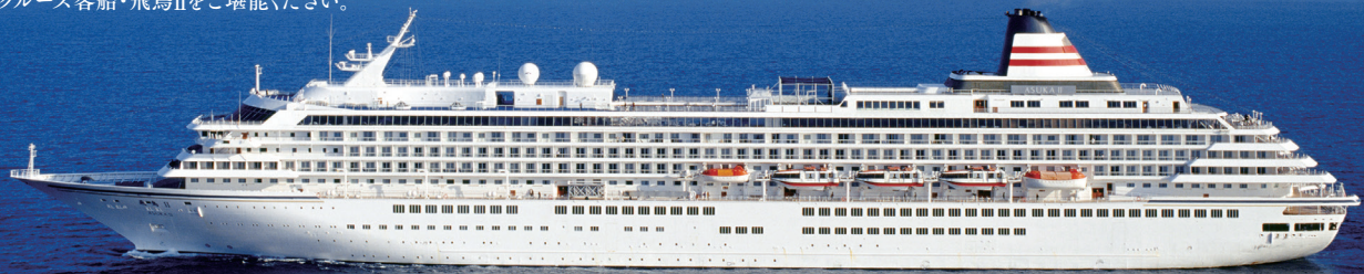
富士山と飛鳥II