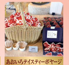
あおいろテイスティーボヤージ