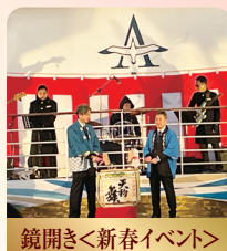
鏡開き<新春イベント>

JTBオリジナルチャータークルーズブランドのひとつである碧彩季航(あおいろきこう)は、全船貸切にてこれまでに17回実施しています。その季節・時期ならではの寄港地や食事・イベントにて旬をお楽しみいただきました。今回は昨年引き続き、新春のひとつを2泊3日の飛鳥II船上にてご満喫ください。洋上で日本各地を楽しむ味覚の大航海“あおいろテイスティーボヤージ”も乞うご期待!