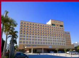
ホテル外観(イメージ)

[所在地] 沖縄県那覇市西3-6-1 [アクセス] ゆいレール「旭橋駅」下車徒歩約15分 [チェックイン] 15:00 [チェックアウト] 11:00 [客室] 洋室/2名1室利用(バス・トイレ付)