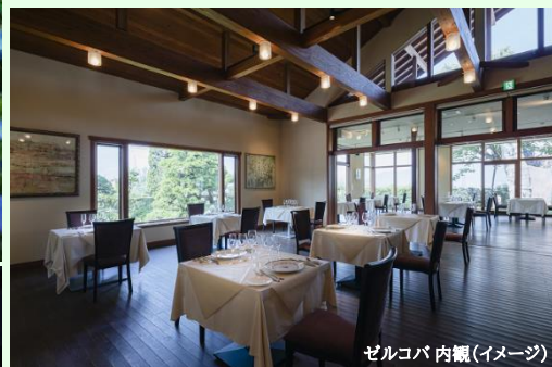
ゼルコバ 内観(イメージ)