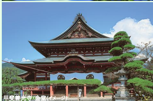
甲斐善光寺・金堂(イメージ)