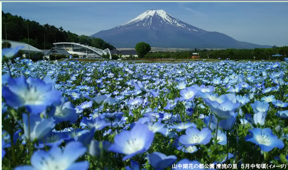
山中湖花の都公園 清流の里 5月中旬頃(イメージ)