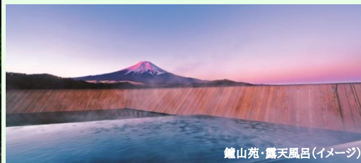
鐘山苑・露天風呂(イメージ)