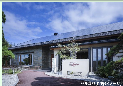
ゼルコバ 外観(イメージ)