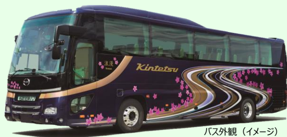
バス外観(イメージ)