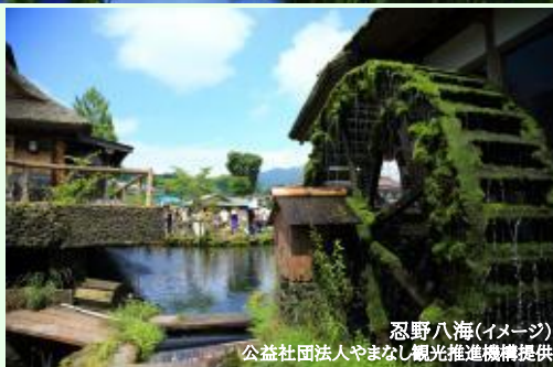
忍野八海(イメージ)