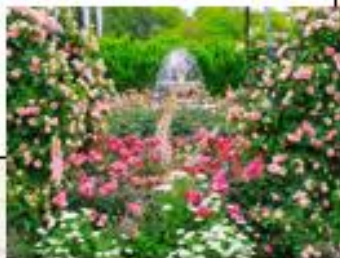
浜名湖フラワーパーク ローズガーデン(イメージ)