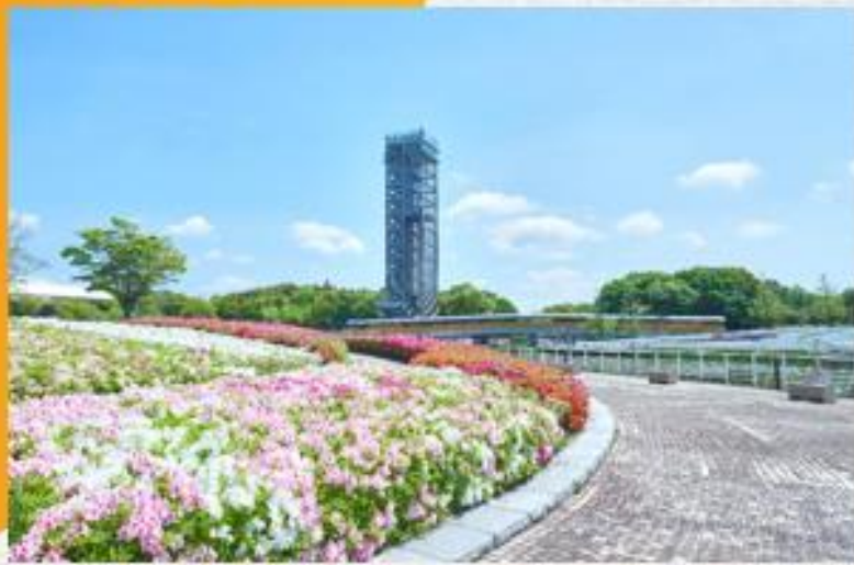
浜名湖ガーデンパーク 展望台(イメージ)